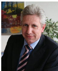
Rainer Rempe Erster Kreisrat