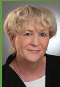
Prof. Dr. Beate Jessel Präsidentin des Bundesamtes für Naturschutz (BfN)

» In Zeiten konkurrierender Nutzungsansprüche und eines damit verbundenen enorm hohen Nutzungsdruckes in unseren Kulturlandschaften sind ausgleichende sowie auf Konsens und Dialog mit den Nutzern und Projektbeteiligten angelegte Momente, wie sie die Flächenagenturen im BFAD e.V. mit ihrem Angebot der Eingriffskompensation bieten, zwingend notwendig. «