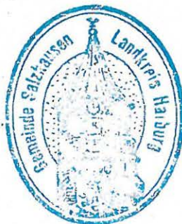
Wolfgang Krause - Gemeindedirektor -