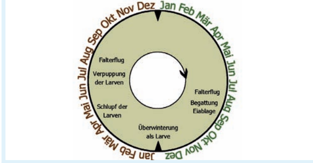
Lebenszyklus von T. processionea

Hohe Ausgangspopulationen deuten darauf hin, dass auch 2011 mit einem verstärkten Auftreten gerechnet werden muss. In einigen Ländern werden lokale Bekämpfungsmaßnahmen vorbereitet und durchgeführt.