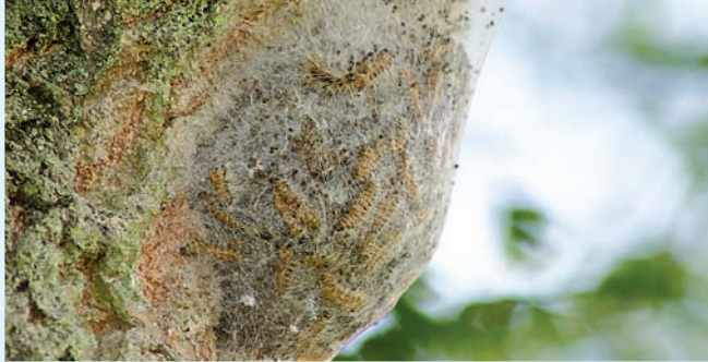
Gespinstnest am Eichenstamm