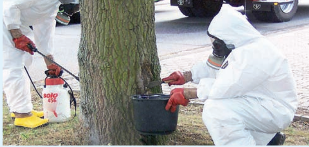
Abtragung von behandelten Gespinsten mit vollständig geschlossenen Schutzanzügen