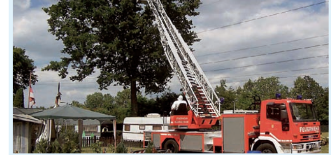
Lokal betroffene Feuerwehrverbände haben Erfahrungen mit schwierigen Bekämpfungssituationen

Auch nach dem Schlupf der Falter bleiben die Gespinstnester mit Häutungsresten und Raupenkot erhalten. Die darin befindlichen Brennhaare verlieren nicht ihre allergische Wirkung. So bleibt die Kontaktgefahr in Befallsgebieten noch über Jahre erhalten.